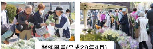
開催風景(平成29年4月)